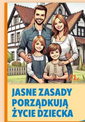
ULOTKA NR 7

Jak rozmawiać z rodzicami, by zostać zrozumianym? W ulotce przekazujemy młodym ludziom zestaw wskazówek na ten temat. Wyjaśniamy, że znaczenie mają drobiazgi - pora, nastrój. Podpowiadamy, przy jakich okazjach warto nawiązać dialog na trudniejsze tematy.