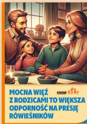
ULOTKA NR 1

Materiały kampanii „Postaw na rodzinę!” od lat przynoszą dobre efekty profilaktyczne w setkach samorządów w całym kraju. Gminy cenią kampanię za pozytywny przekaz i akcentowanie roli rodziny w profilaktyce zachowań ryzykownych. Wydawnictwa kampanii są chętnie wykorzystywane przez szkoły, m.in. podczas lekcji wychowawczych, spotkań z rodzicami, pogadanek profilaktycznych. Ulotki są doskonałym uzupełnieniem pikników i innych imprez plenerowych organizowanych w gminie.