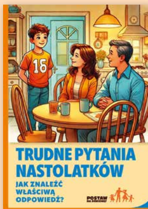
ULOTKA NR 5

Jak być asertywnym? W ulotce podpowiadamy młodym ludziom, jak mówić „nie”, a jednocześnie zachować dobre relacje z rówieśnikami. Pokazujemy dowody na to, że spożywanie alkoholu przez nieletnich niszczy mózg i rzutuje na całe późniejsze życie.