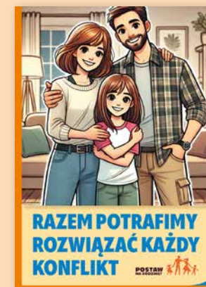
ULOTKA NR 8

Ustalenie zasad pozwala uporządkować życie nastolatka i zrozumieć, czego rodzice od niego oczekują. W ulotce przekonujemy rodziców, że warto ustalać jasne zasady panujące w domu oraz konsekwencje za ich łamanie. Apelujemy, by okazywać dzieciom zainteresowanie.