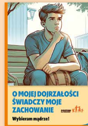
ULOTKA NR 3

Czy zezwolić nastolatkowi na udział w imprezie? Jak zapewnić młodzieży bezpieczną zabawę? W ulotce podajemy kilka sprawdzonych porad. Wyjaśniamy, jak rozmawiać z dziećmi o alkoholu i zachęcamy, by dawać dobry przykład. Młodzi ludzie uczą się przez naśladowanie!