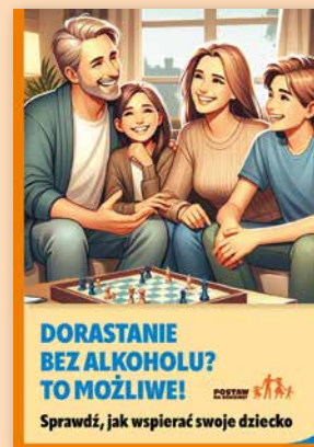
ULOTKA NR 2

W ulotce przekonujemy, że silna więź z rodzicami to najskuteczniejszy czynnik chroniący młodych ludzi przed używkami. Pokazujemy wyniki badań, które dowodzą, że dzieci, które zaczęły spożywać alkohol przed 15. rokiem życia częściej uzależniły się w dorosłym życiu niż te, które po raz pierwszy alkohol spożyły w okresie pełnoletności.