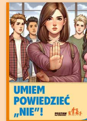
ULOTKA NR 4

W ulotce wyjaśniamy młodym ludziom, dlaczego nie warto sięgać po alkohol. Pokazujemy, że picie w młodym wieku powoduje poważne konsekwencje. Przekonujemy: unikanie używek, poważne traktowanie szkolnych obowiązków oraz życzliwe podejście do rodziny i kolegów zaprezentują w przyszłości!