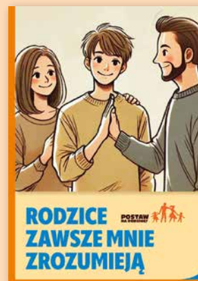
ULOTKA NR 6

Pytania dorastających dzieci potrafią zaskoczyć. Czy da się na nie przygotować, by udzielić rzetelnej wiedzy, która będzie wprawdą dla dziecka? Oczywiście! W ulotce przedstawiamy przykładowe odpowiedzi na trudne pytania, które może zadać nastolatek.